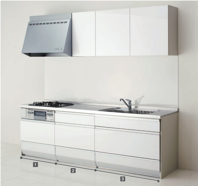
写真のセットは間口255cm、扉はCクラス/クリスタホワイトです。(金額にクリン壁パネルは含まれておりません。)